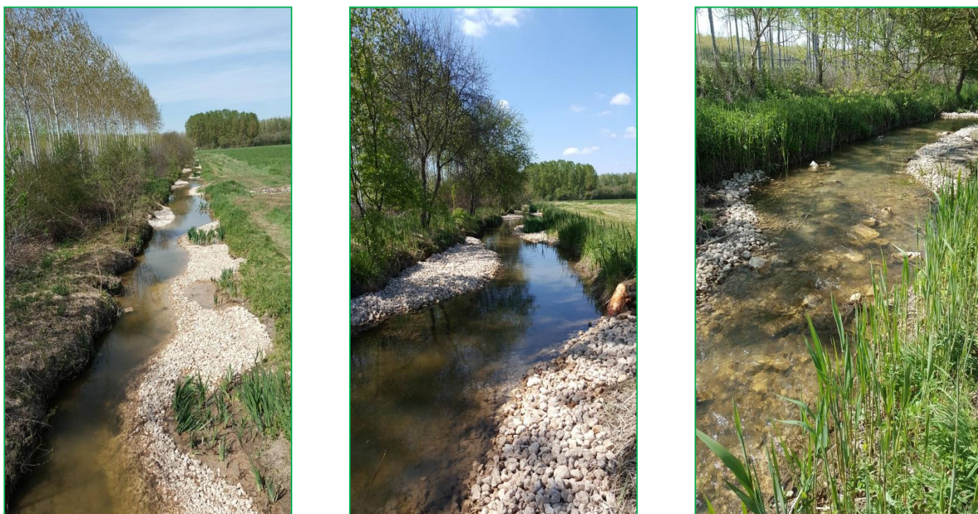
Photo après travaux

Les pierres de champs et les blocs épars sont de nature calcaire et proviennent des communes avoisinantes afin de garantir la similarité des matériaux avec le sous-sol et réduire les coûts de transport. Les banquettes ont été réalisées d'aval en amont, en période de basses eaux à l'aide d'une pelle hydraulique de 15 tonnes.