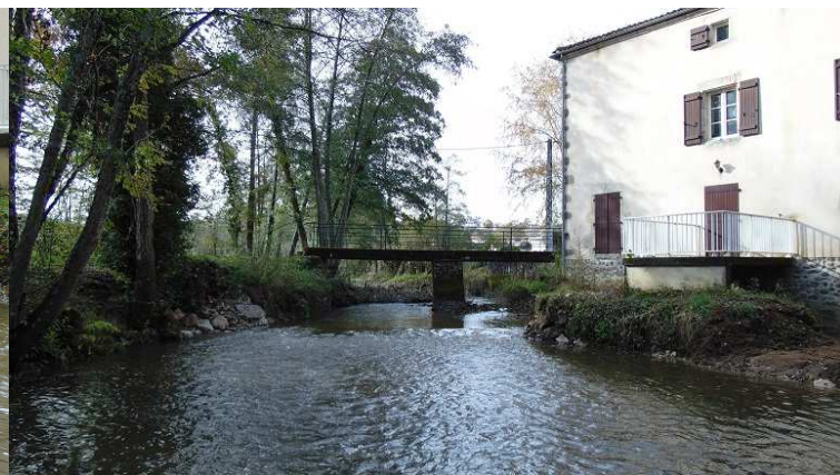
Photo après travaux