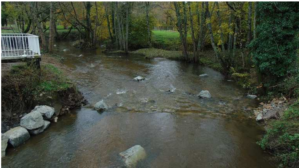
Vue depuis la passerelle sur le radier aménagé à la place du seuil et sur les blocs rocheux

La démarche de travail a mobilisé les acteurs locaux (mairie, association de pêche, services de l'Etat,...) qui se sont impliqués dans le projet et ont permis son aboutissement sous la maîtrise d'ouvrage du syndicat. Il s'agit d'une première opération de restauration de la continuité écologique pour le SIGIV concrétisant les attentes des élus locaux. Ce site a vocation à devenir une vitrine pour faciliter de nouveaux projets sur le territoire.