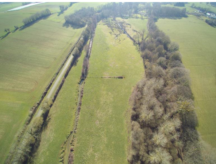
Après travaux (Janvier 2020)