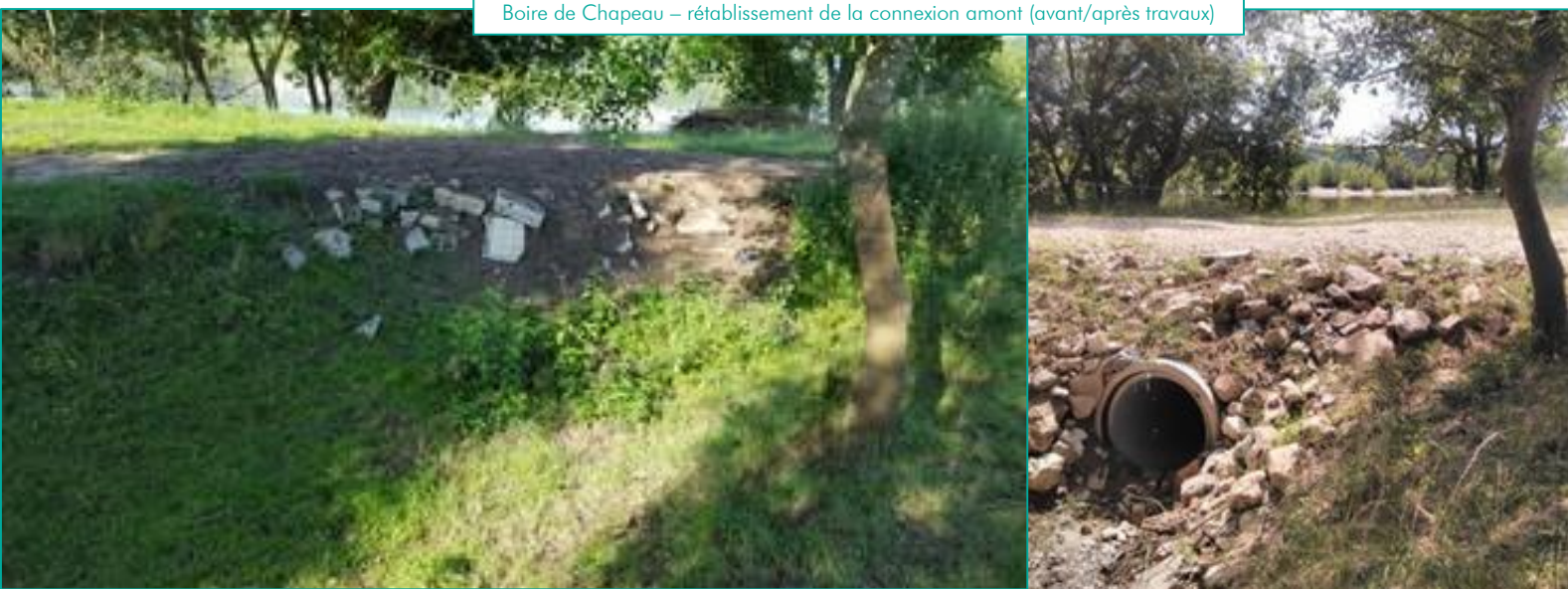
Boire de Chapeau – rétablissement de la connexion amont (avant/après travaux)