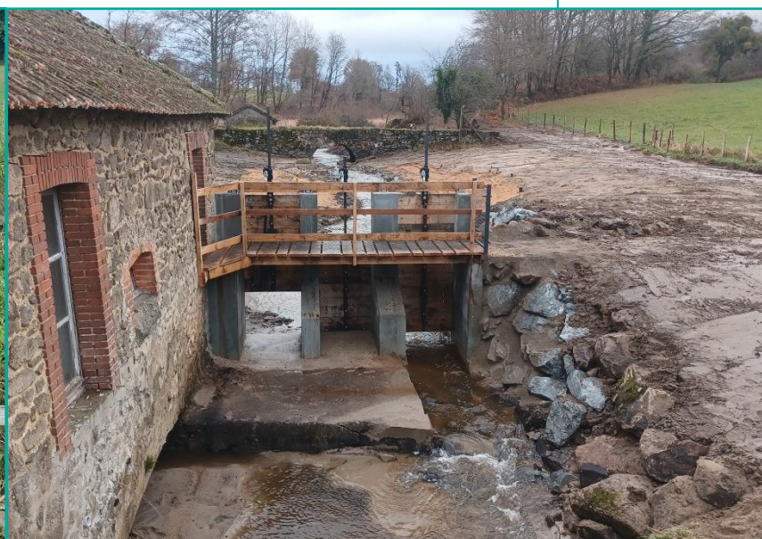
avant / après travaux