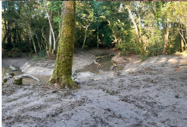
Terrassement de l'ancien bras

Retrouvez l'ensemble des fiches du Répertoire d'Exemples TMR sur www.tmr-lathus.fr