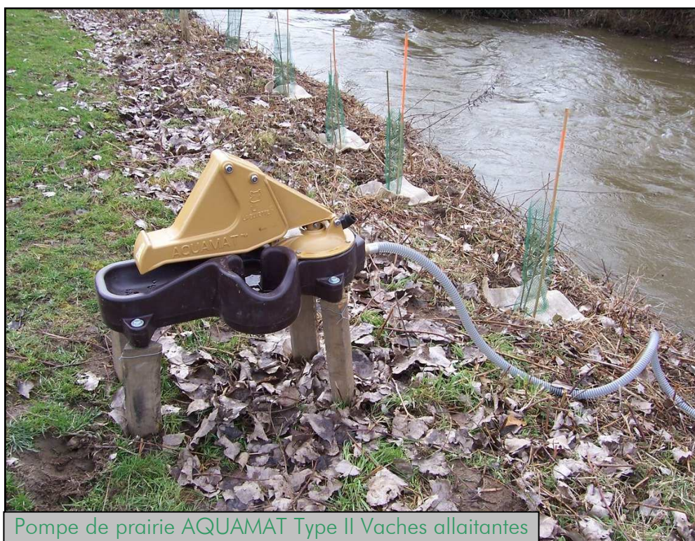
Pompe de prairie AQUAMAT Type II Vaches allaitantes

Il est préconisé une pompe pour un troupeau de 10 à 15 bovins. Il est donc souvent nécessaire d'installer deux pompes par prairie.