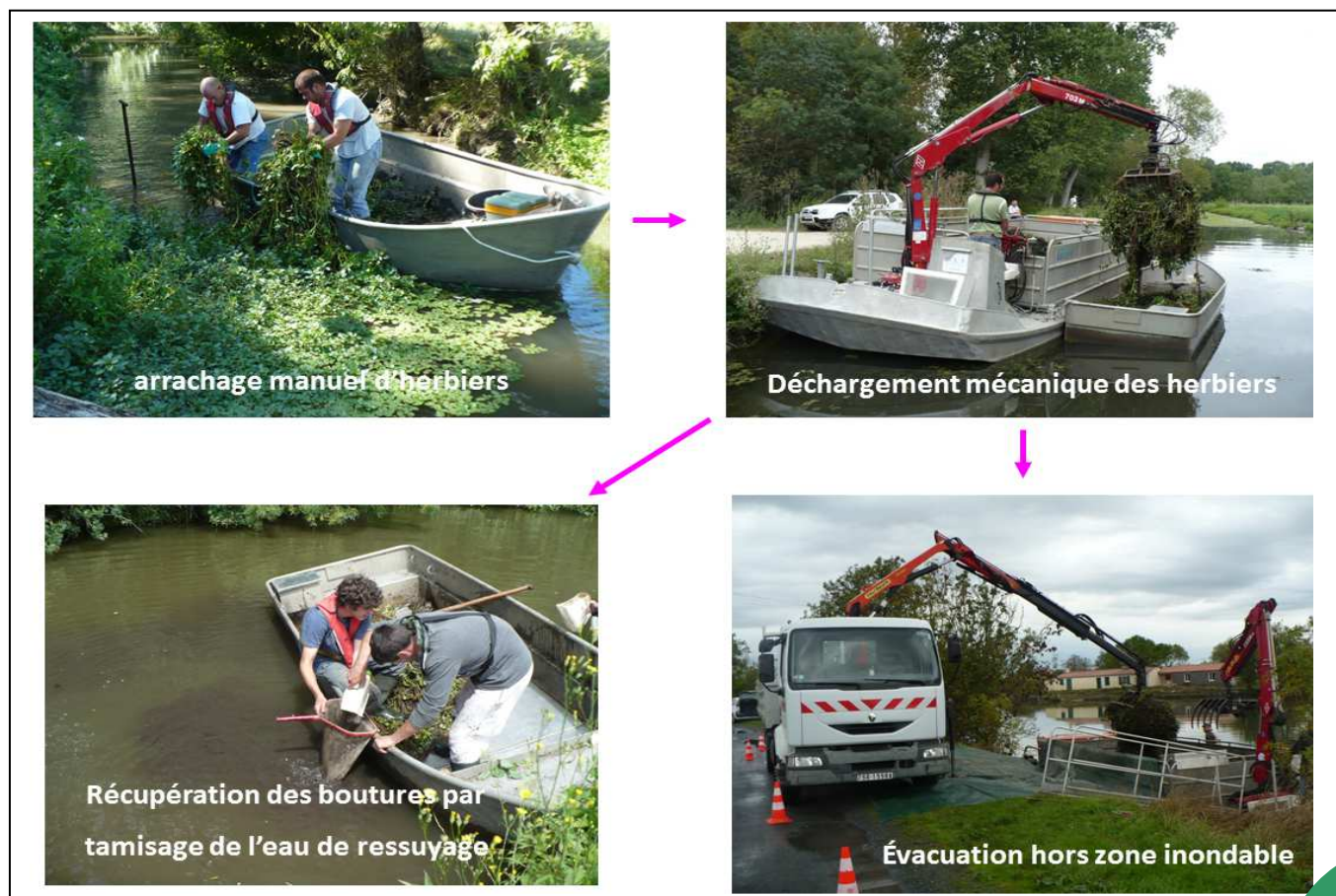
Illustration schématique du déroulement de l'opération

Il s'agit de pratiquer un arrachage manuel méthodique et le déchargement des herbiers en prenant soin d'éliminer l'ensemble des boutures sans fragiliser les écosystèmes indigènes (berges, autre végétation subaquatique, hélophytes, ...). Les végétaux sont alors déposés dans des chalands de stockage provisoire, déchargés sur camions-benne à l'aide de la barge munie d'un bras hydraulique, puis évacués hors zone inondable. A noter le travail de récupération de toutes les boutures flottantes en transit, sources potentielles de nouvelles contaminations (plus de 31 700 en 2013). Les opérations s'effectuent à partir d'embarcations spéciales qui assurent un stockage important de végétaux, une stabilité de manœuvre et l'accès en bord de rive. Dès l'arrachage des herbiers, des dispositions particulières sont prises afin de ne pas disséminer les boutures au fil du courant (tamisage de l'eau ressuyée, protection de la berge lors des évacuations, barrages flottants...).