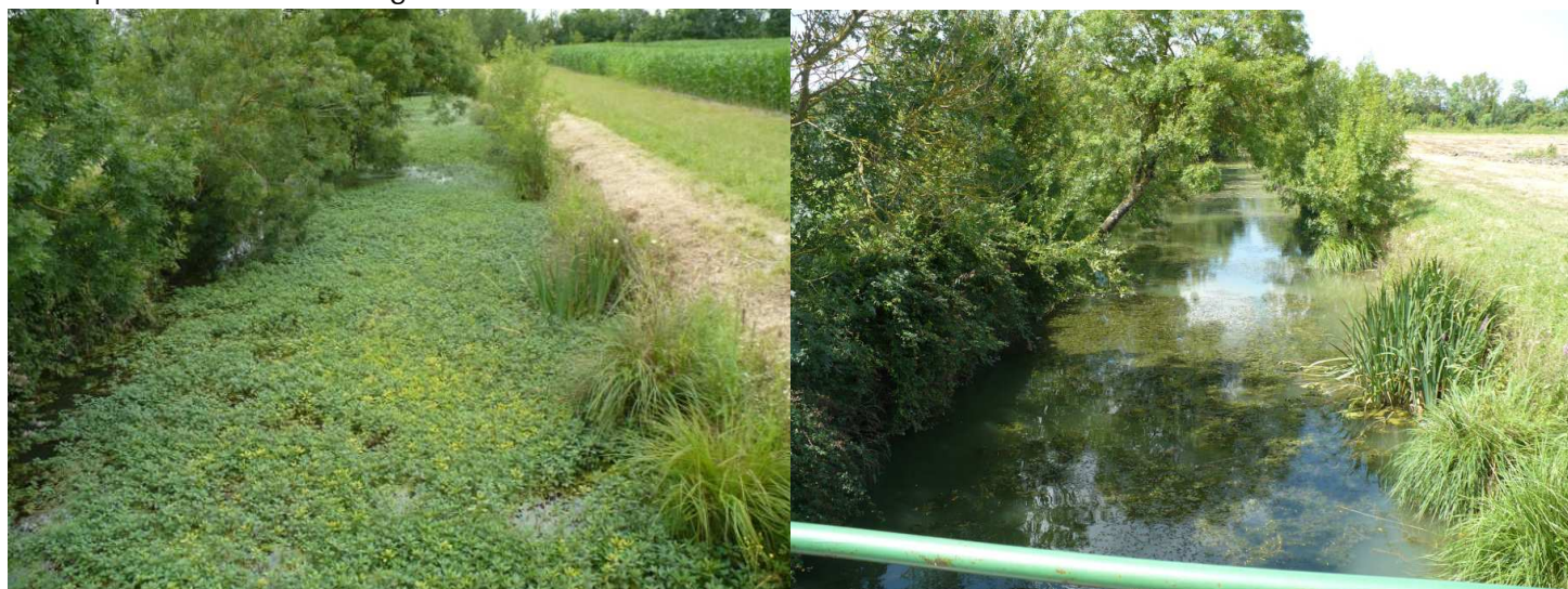
Voie d'eau avant et après interventions sur jussie