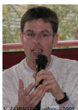
S. LORIOT - lathus - 2005

La création de cette structure, compétente à l'échelle du bassin de la Vienne, s'inscrit dans la continuité de la démarche collégiale initiée, depuis plusieurs années par ces collectivités, en faveur de la gestion de l'eau notamment dans le cadre de l'élaboration du Schéma d'Aménagement et de Gestion des eaux (SAGE) du bassin de la Vienne approuvé en juin 2006.