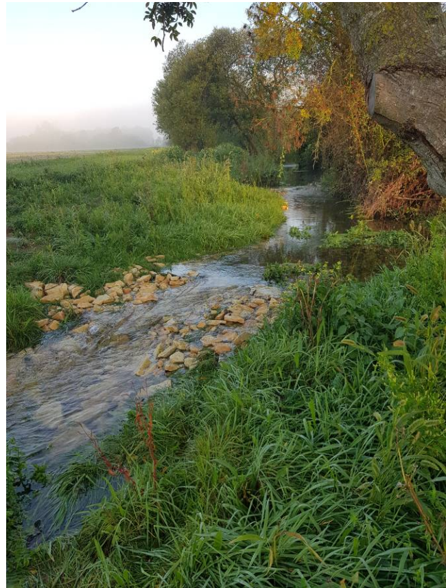
Le Crachon restauré

La conduite des travaux est un élément majeur dans cette réalisation. Il est important d'ajuster l'aménagement au fur et à mesure de son exécution. Le cours d'eau étant de petit gabarit, ce type d'aménagement permet vraiment d'impacter rapidement le milieu aquatique. De plus, il est possible de traiter un linéaire important de façon journalière lors des travaux.