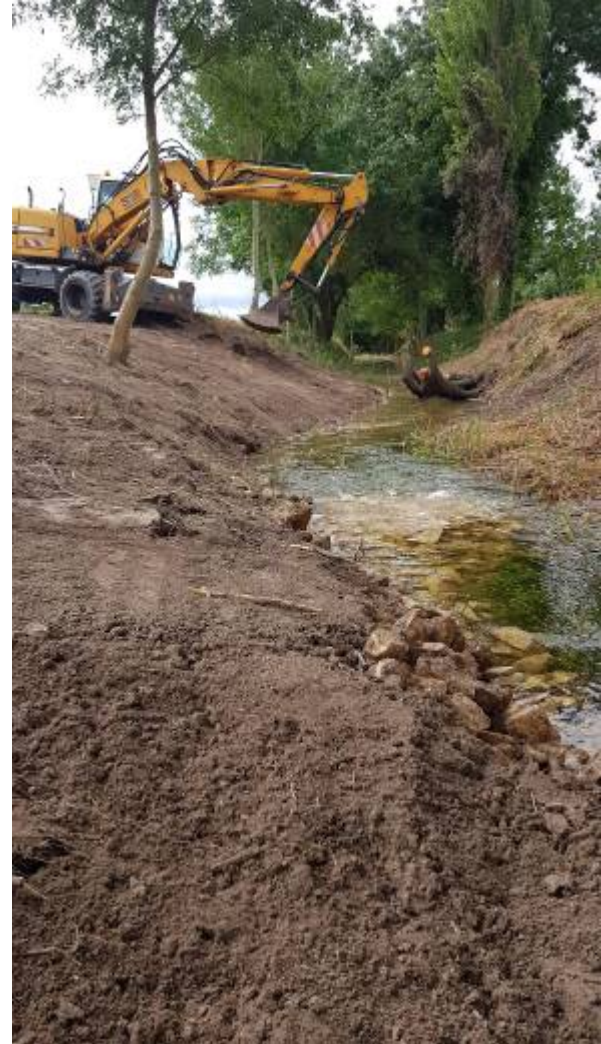
Retalutage de la Divise

PDT du Syndicat au moment de travaux : Franck BONNET - Maison de l'eau 16140 Saint-Fraigne.