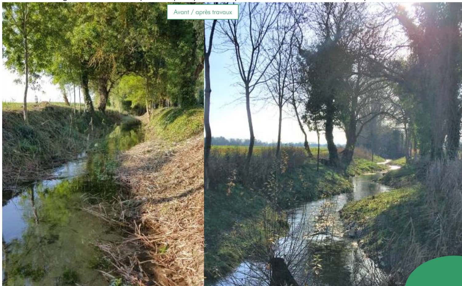
Avant / après travaux